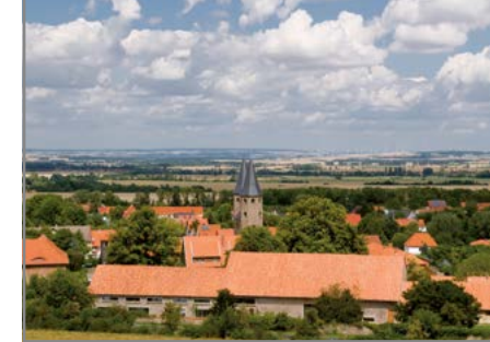
Auf Erkundungstour durch den Harz