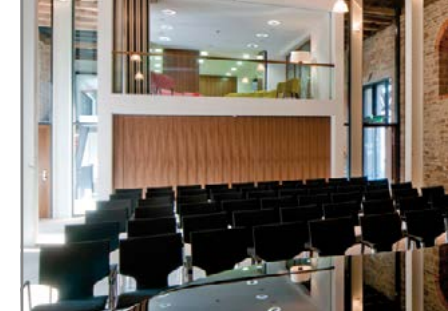
Adelbrinsaal in der Domänenscheune