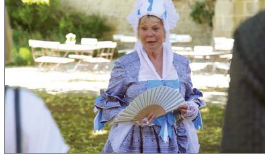
Kostümführung mit der Gräfin