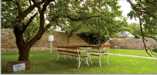
Zu Gast im Kloster Drübeck