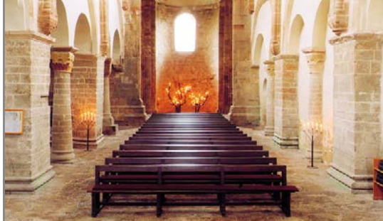
Blick auf den brennenden Dornbusch