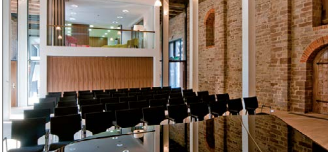
Adelbrinsaal in der Domänenscheune