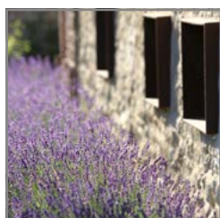
Lavendel an der Domänenscheune