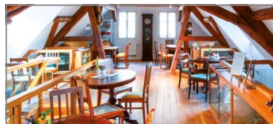
Urige Atmosphäre im Gärtnerhaus

Im Gärtnerhaus am Nussgang finden Sie das gemütliche Kloster-Café mit kleinem Klosterladen. Probieren Sie den selbst gebackenen Kuchen, dazu eine gute Tasse Tee, Kaffee oder frischen Wein, oder stöbern Sie zwischen Büchern, regionalen Produkten, Schmuck und allerlei Kunsthandwerk. Zum Tagesausklang in gemütlicher Runde oder ganz für sich erwartet Sie das Gärtnerhaus als abendliche Weinstube.