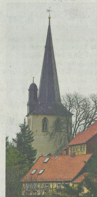
Der Turm von St. Bartholomäus erhebt sich dekorativ über die umliegenden Fachwerkhäuser von Blankenburg.