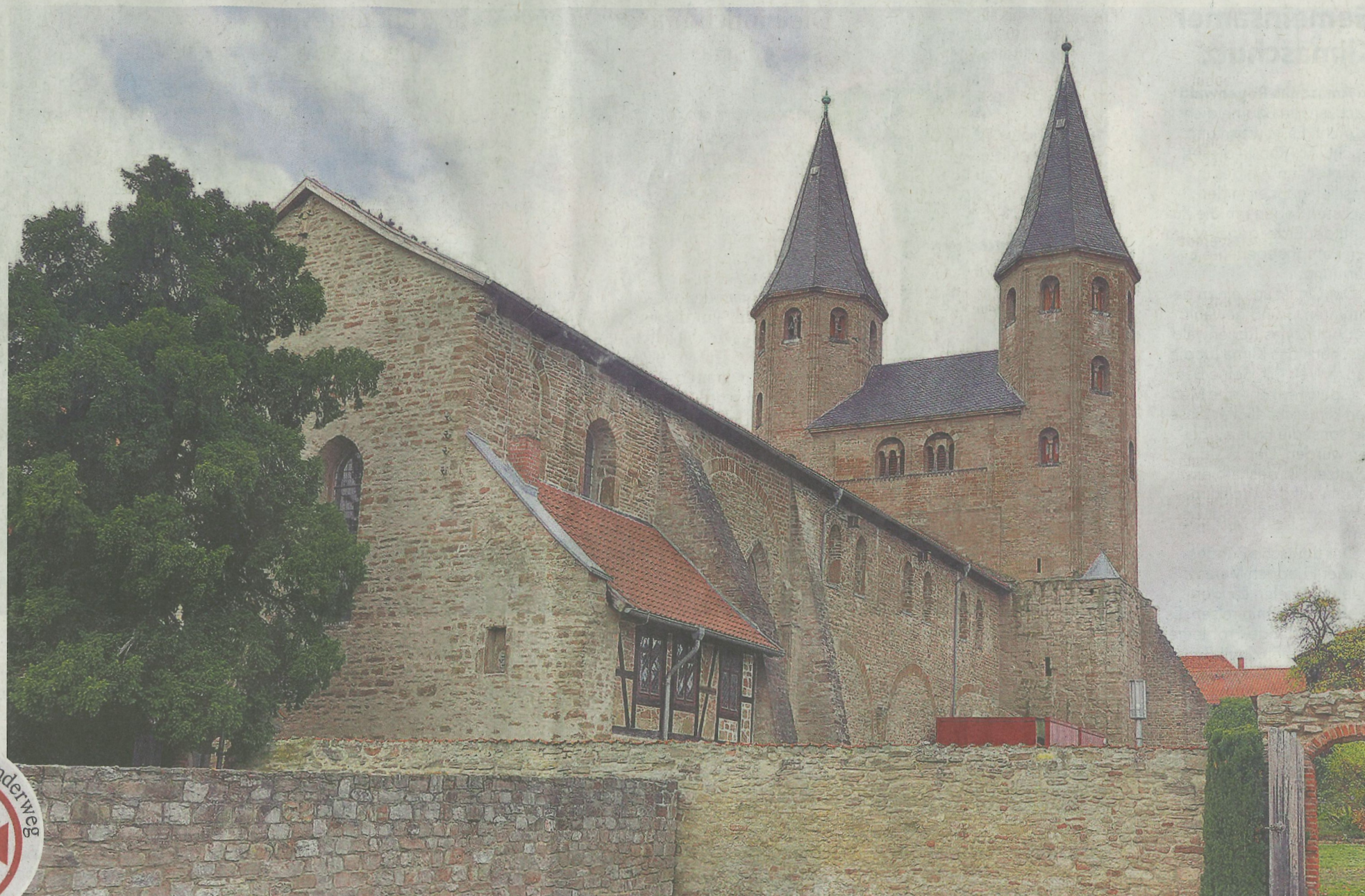
Kloster Drübeck ist wohl so etwas wie der geistige Mittelpunkt des Klosterwanderweges.

Die offizielle Karte zum Pilgerwanderweg hilft nur bedingt weiter, brauchbarer ist die App Kartoguide Harz, für die allerdings gezahlt werden muss. Kleinere Um- und Irrwege gehören nicht nur beim Klosterwanderweg einfach