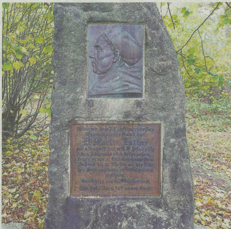
Was von Himmelpforte übrig blieb: Der Lutherstein, der an den Besuch des Reformators im Kloster erinnert.